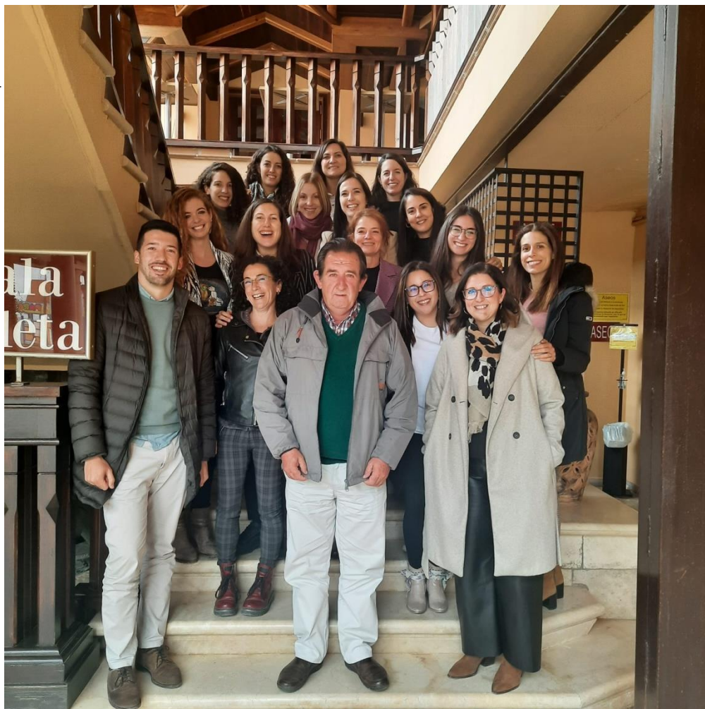
NUESTRO PRESIDENTE, CON PARTE DE NUESTRO EQUIPO TERAPÉUTICO.